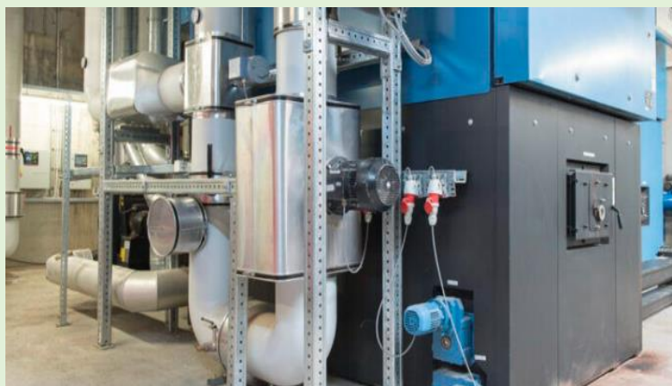
Holzheizkessel des Wärmeverbundes Lenzerheide

Leisten Sie als Käufer der CO 2 -Einsparungen einen Beitrag zum Klimaschutz in der Schweiz. Sie können das Projekt und damit den Preis wählen. Durch die lokale Wertschöpfung bleibt Ihr Geld in der Schweiz und zirkuliert dort im Wirtschaftskreislauf. Somit fließen die Heizkosten nicht mehr ins Ausland zu Gasoligarchen und Ölscheichs.